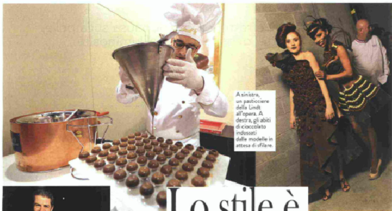
A sinistra, un pasticciere della Lindt all'opera. A destra, gli abiti di cioccolato indossati dalle modelle in attesa di sfilare.