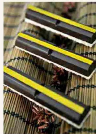
Snack orange e passion fruit