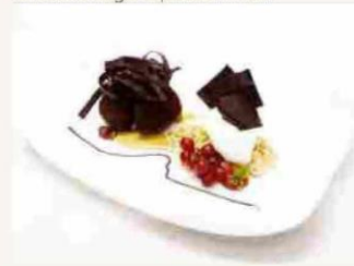
AMARETTO AL FONDENTE GUANAJA 70% CON CUORE DI MANGO